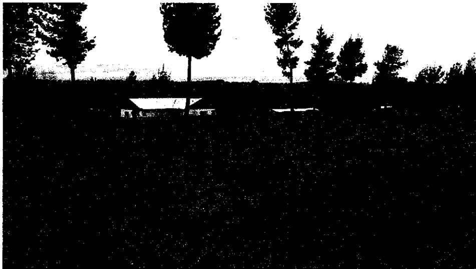
Establecimiento del área