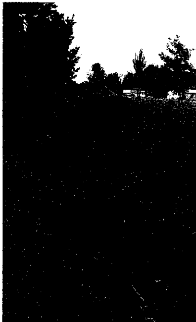
Planta de Roble