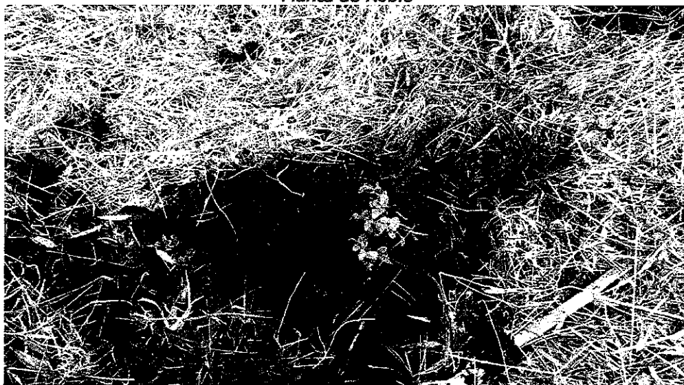
Planta de Roble